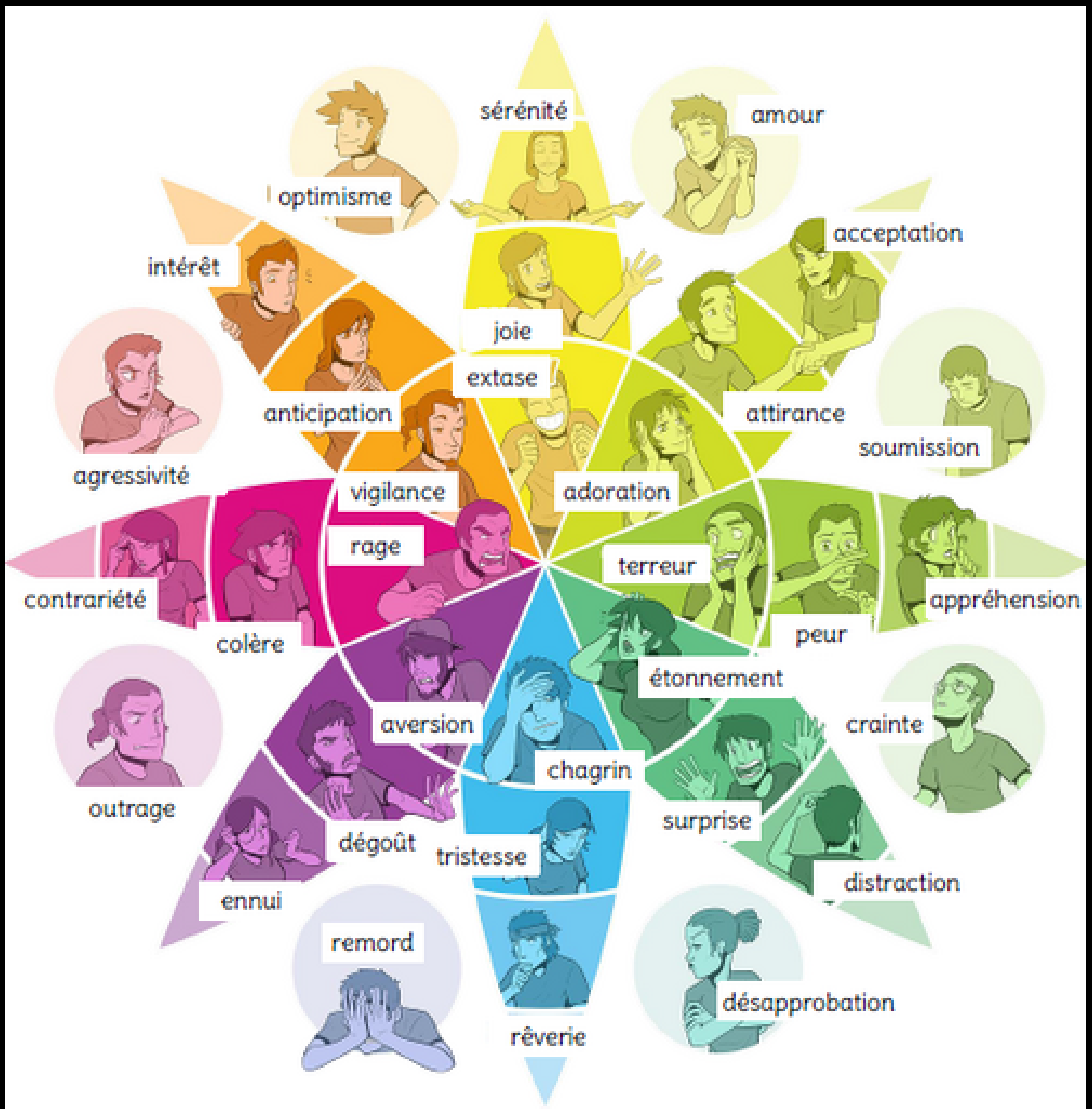
PLUTCHIK " LA ROUE DES ÉMOTIONS "